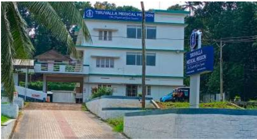
ഒന്നാം ഘട്ട പണി പൂർത്തിയാക്കിയ മന്ദമരുന്നി ആശുപത്രി

രണ്ടും മൂന്നും നിലകളാണ് പുതുതായി സമർപ്പിച്ചത്. രോഗികൾക്കുവേണ്ടി 11 A/c Deluxe, IP മുറികൾ, അക്കൗണ്ടന്റ് റൂം, ഡെന്റൽ റൂം, ഡോക്ടേഴ്സ് കൺസൾട്ടേഷൻ റൂം, നഴ്സസ് സ്റ്റേഷൻ എന്നിവയാണ് ഈ നിലകളിൽ ഉള്ളത്. പ്രഗത്ഭരായ ഡോക്ടർമാരുടെ സേവനം 24 മണിക്കൂറും ഇവിടെ ലഭ്യമാണ്.